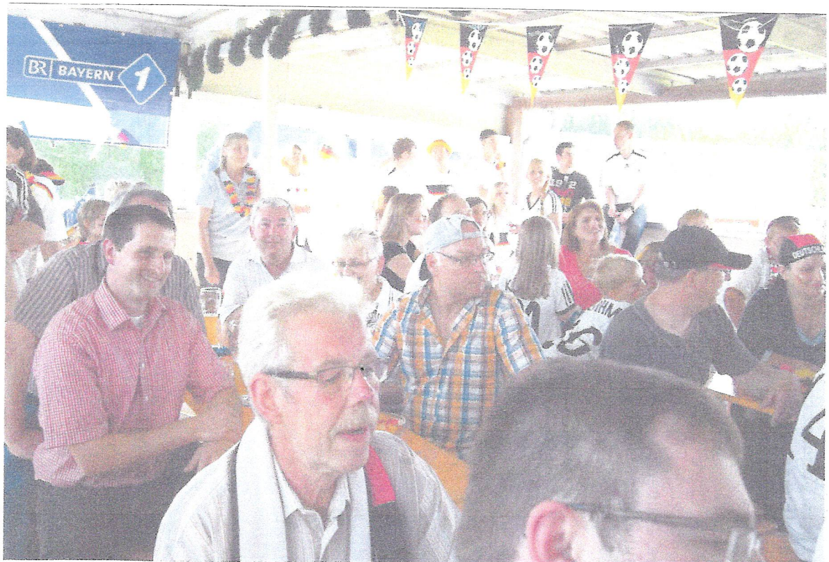
Auch die Terrasse war bei der Übertragung vollbesetzt.