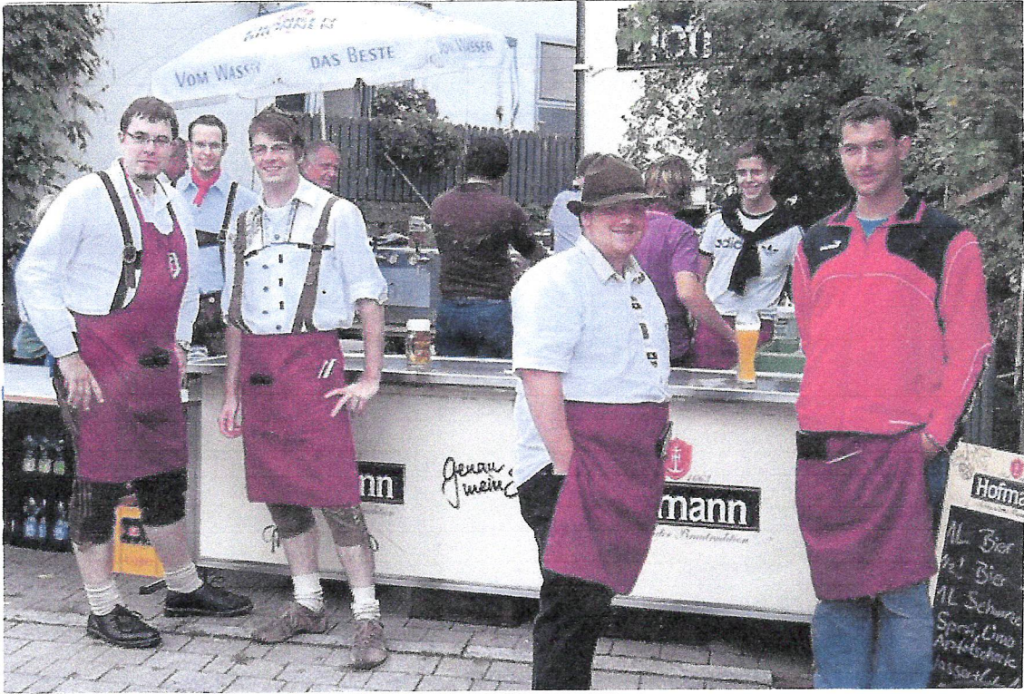
Auch das Ausschankteam ist bereit