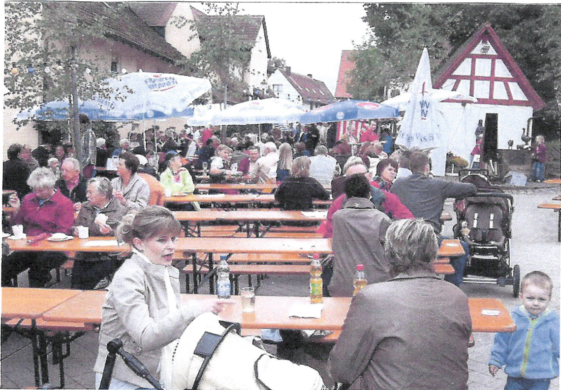
Nachmittags war es noch trocken