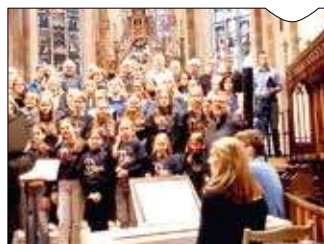
Bericht der Sänger