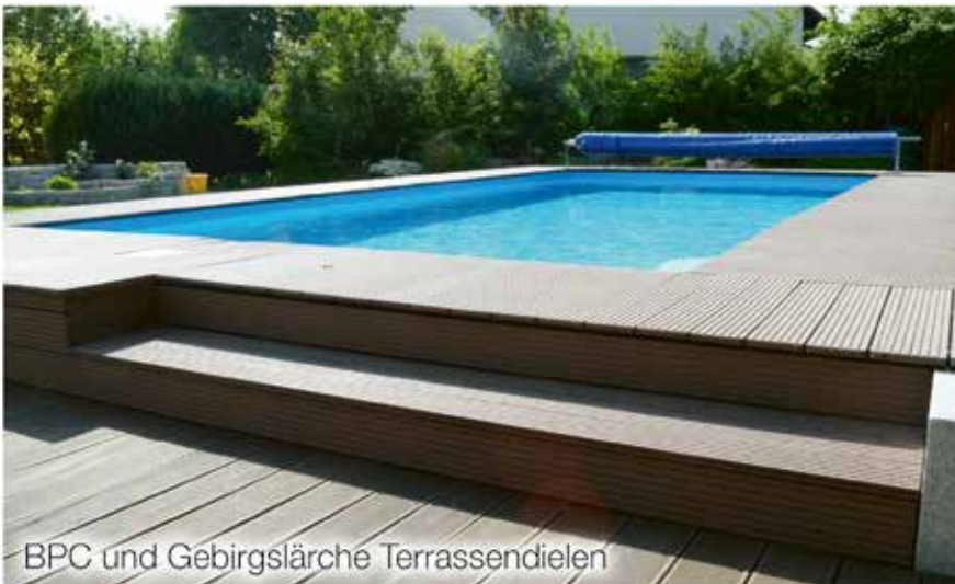
BPC und Gebirglärche Terrassendielen

Auszeit nehmen und Freizeit zuhause genießen