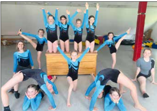
Unsere Turn-Maxis nach ihrer Boden-Kasten Übung.