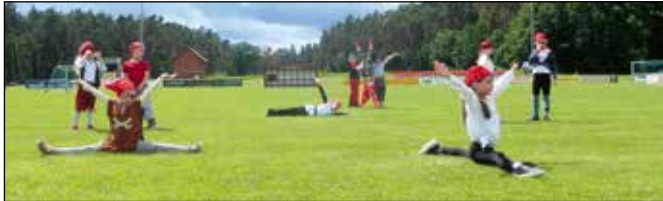
Unsere Turn-Minis mit ihrem Piratentanz.

Der Rasen war trotz Regen am gleichen Tag trocken und den Aufführungen stand nichts im Wege. Gestartet hat die Mutter-Kind Gruppe mit zwei Aufführungen. Danach kamen unsere Springmäuse, die verkleidet und bemalt als Tiger einen großartigen Tanz gezeigt haben. Unsere Ältesten – die Turn-Maxis – zeigten keinen Tanz, sondern eine Boden-Kasten-Übung mit verschiedenen Sprüngen und statischen Elementen, wie der Schulterstand. Zuletzt kamen unsere Turn-Maxis und führten einen Piratentanz auf.