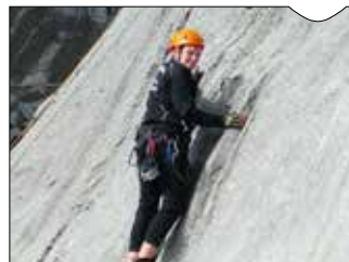
25 Jahre Klettergruppe